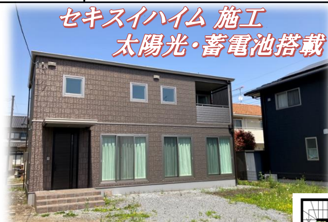
現地外観 ※街並み含む 掲載写真 2023年4月撮影